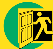
1 Ga direct naar binnen