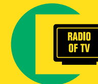
3 Zet radio of tv aan

Elke eerste maandag van de maand om 12.00 uur worden de sirenes getest