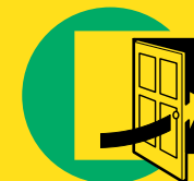
2 Sluit deuren en ramen